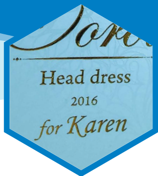
可變數據燙金/銀印刷功能(VDF)